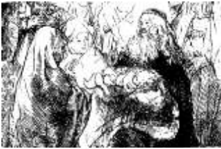
Darstellung des Herrn (Mariä Lichtmess)