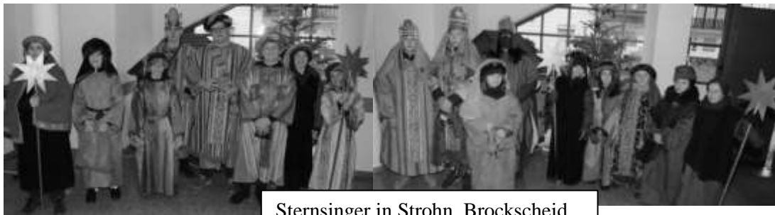
Sternsinger in Stroh, Brockscheid, Strotzbüsch und Gillenfeld