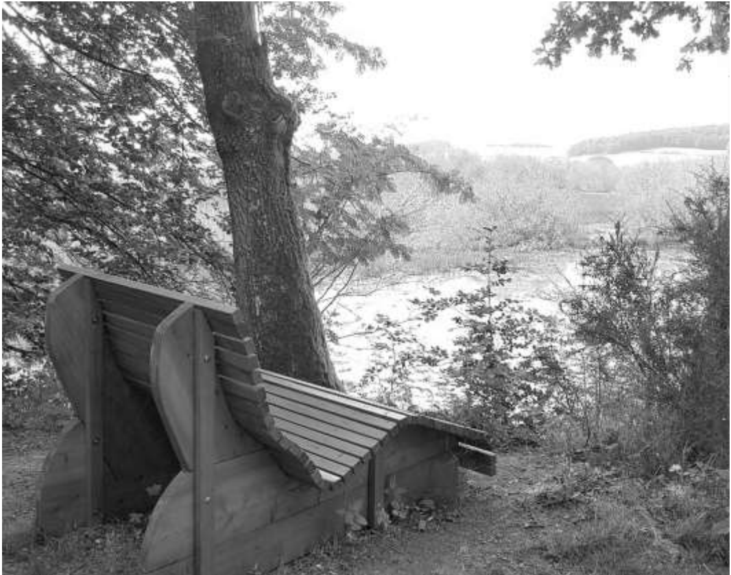
Foto: Mürmes in Ellscheid